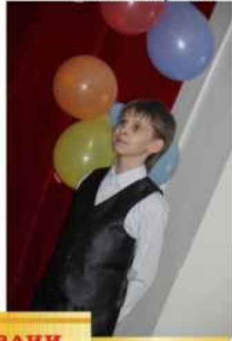
Самый юный участник