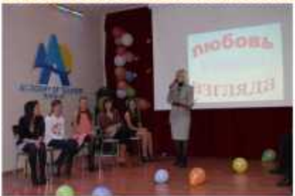
Участникам пришлось отвечать на каверзные вопросы ведущей