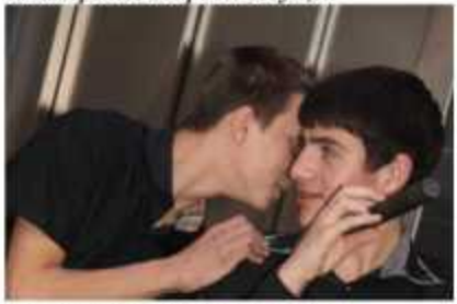
Не обошлось и без подсказок...